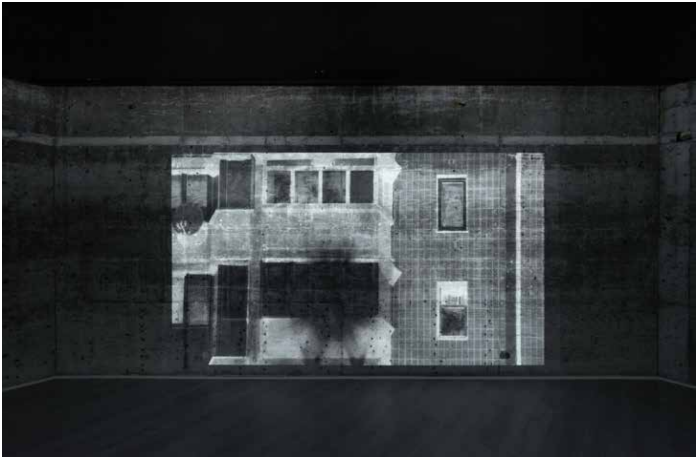
Verk av kunstprisvinneren 2023, Lesia Vasylychenko